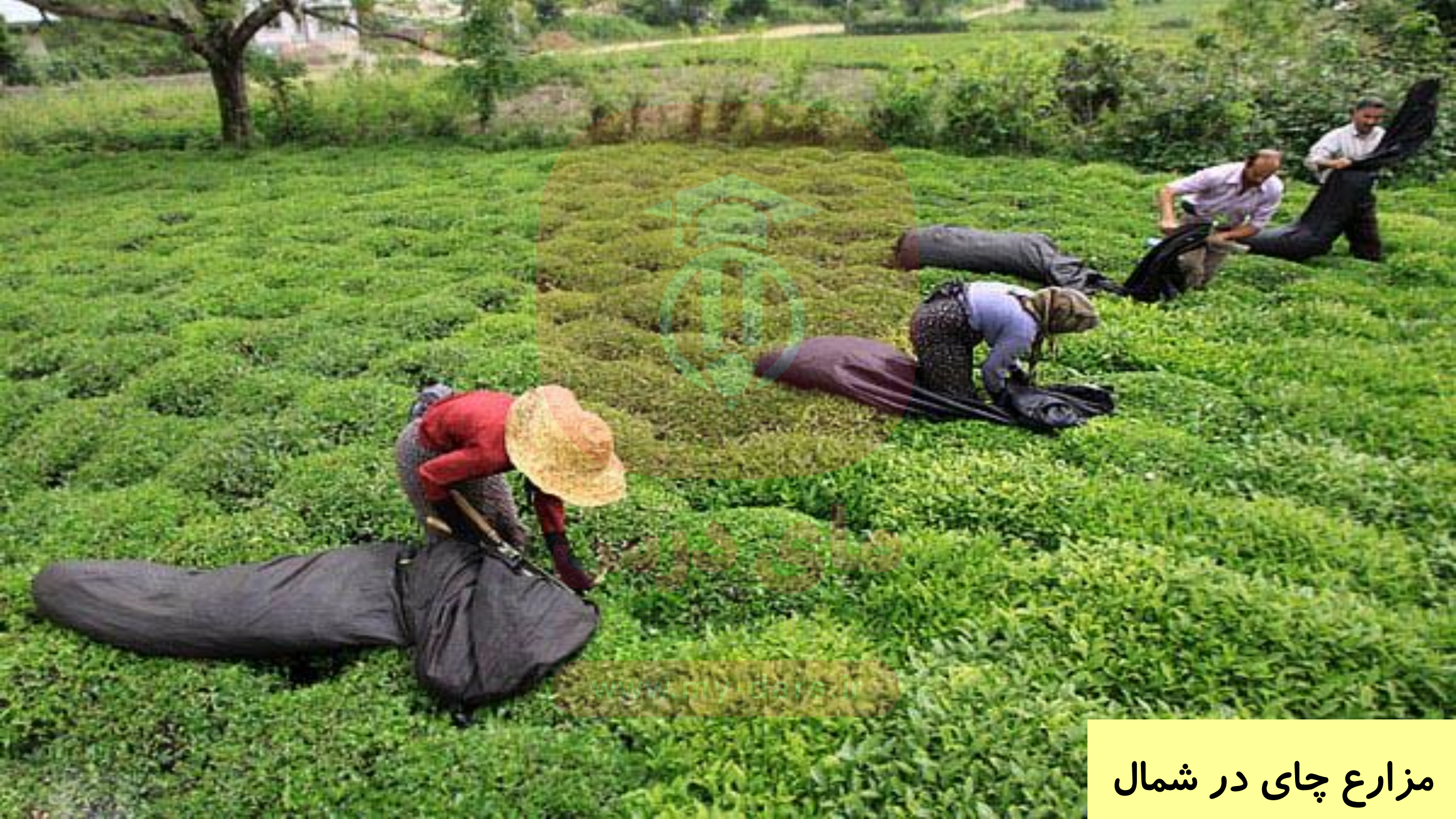
مزارع چای در شمال